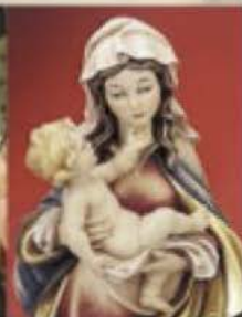
Objets d'art sacré Esculturas sacras en madera Религиозная деревянная скульптура