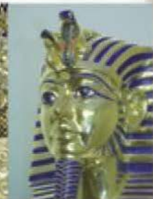
Histoire Historia История

Parmi les sculptures sur bois de Val Gardena, il y en a pour tous les goûts.