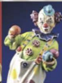
Objets profanes Esculturas profanas en madera Светская деревянная скульптура