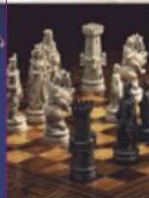
Jeux d'échecs Figuras de ajedrez Шахматные фигуры