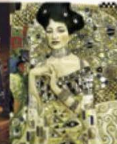
Histoire de l'art Historia del arte История искусств