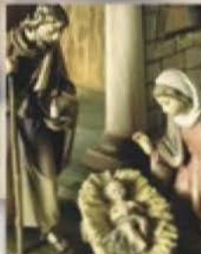
Crèches de Noël Belenes navideños Ясли младенца Иисуса